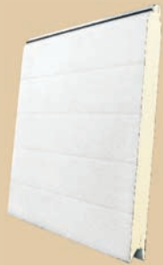
* acanalado woodgrain