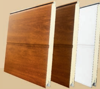
unicanalado liso - PVC