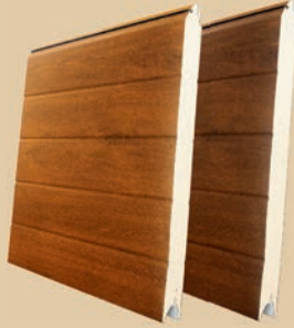
acanalado liso - PVC