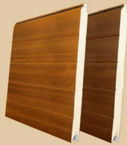
acanalado liso - lacado